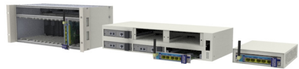
Compatible con múltiples chasis TELNET