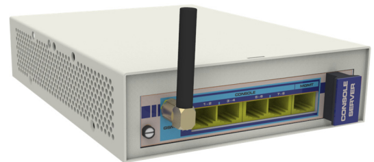
TELNET Console Server