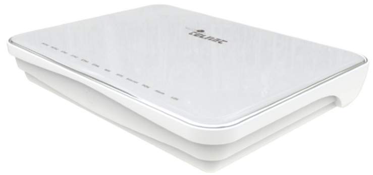
WaveAccess serie 4000 PoE+

4x1GbE, 2xPOTS, 1xRF, 4xPOE+, WiFi 802.11b/g/n & ac