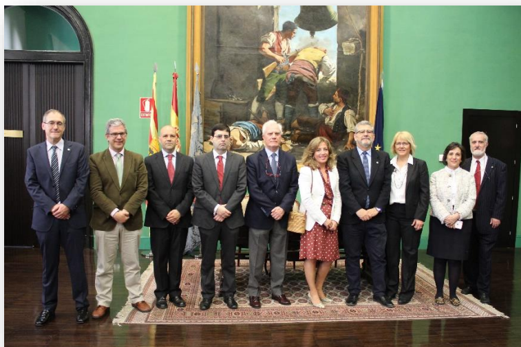
Acto de constitución de la Cátedra TELNET para la promoción de las tecnologías 5G E IoT, en mayo de 2019 en el Paraninfo de la Universidad de Zaragoza