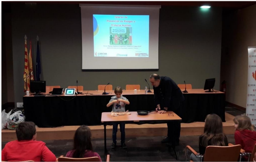
Taller de prevención de riesgos en el hogar, para hijos de trabajadores de TELNET Redes Inteligentes, S.A., celebrado en la sede de CEOE Aragón el 30/11/2019

TELNET Redes Inteligentes S.A. ha identificado los siguientes impactos, riesgos y oportunidades a nivel económico :