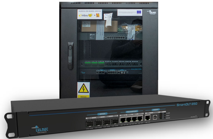
Rack GPON FTTH Rural basado en SmartOLT 250

Solución standalone lista para despliegues FTTH rurales